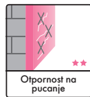
Otpornost na pucanje