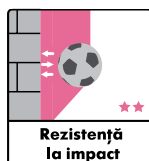
Rezistență la impact