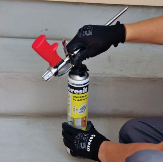
Pistoles uzskrūvēšana uz tvertnes

Iepakojuma tvertnes temperatūrai jābūt no +5°C līdz +30°C. Pirms lietošanas tvertne ar putām jāuzglabā istabas temperatūrā vismaz 12 stundas. Pirms darbu sākšanas tvertne jāsakrata apmēram 20 reizi, jānoņem no tvertnes uzgaļa drošības vārsts un stingri jāuzskrūvē pistole.