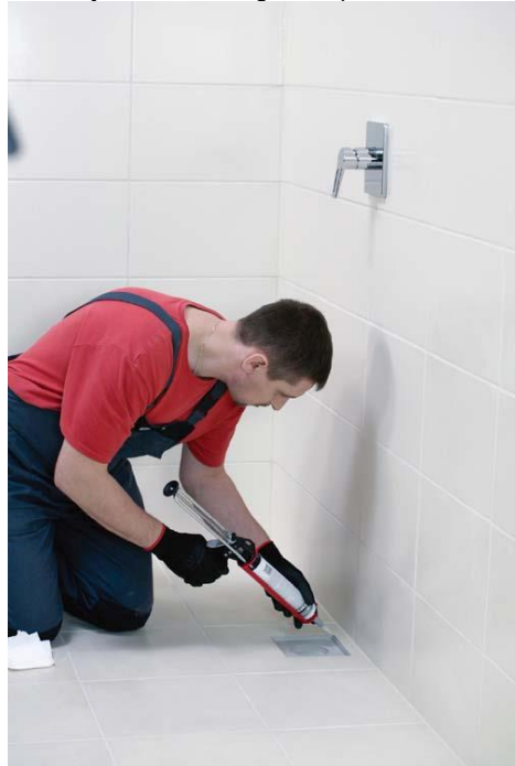
Nuotekų grotelės žiedo sandarinimas

Jei naudojote, nulupkite lipniąją juostelę. Šviežias silikono dėmes reikia nuplauti muiluoju vandeniu arba petroleteriu, sukietėjusias dėmes galima pašalinti tik mechaniškai.