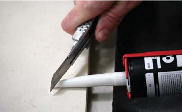
Flakono antgalio viršutinės dalies nupjovimas

Nupjaukite viršutinę flakono dalį virš sriegio. Užsukite antgalį, pritaikę jį prie flakono ertmės dydžio.