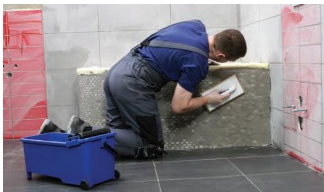
CE 40 glaistas puikiai tinka ir mozaikinių plytelių siūlėms glaistyti.

Glaisto perteklių surinkite drėgna kempine (stipriai išgręžta), dažnai ją praskalaudami. Nevalykite siūlių sausa šluoste, kad išvengtumėte glaisto spalvos pakitimo, kuris atsiranda sausą glaistą įtrinant į šlapį. Vaikščioti galima praėjus 6 valandoms nuo glaisto užtepimo. Pirmąsias 5 dienas po glaisto užtepimo naudokite tik švarų vandenį be jokių valymo priemonių.