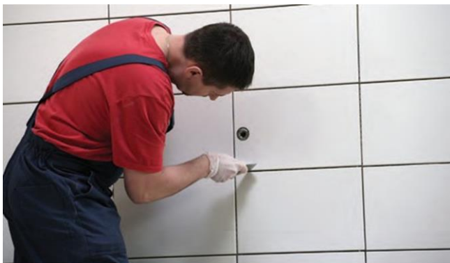
Plytelių siūlių valymas prieš glaistant

Išvalykite plytelių siūles iki pagrindo. Siūles pradėkite glaistyti tik plytelių klijams visiškai sukietėjus ir išdžiūvus. Prieš pradėdami glaistyti plyteles, patikrinkite, ar CE 40 nepalieka neišvalomų dėmių ant plytelių paviršiaus (priešingu atveju, prieš glaistant reikia impregnuoti CT 10). Nuvalytus plytelių kraštus suvilgykite drėgna kempine.