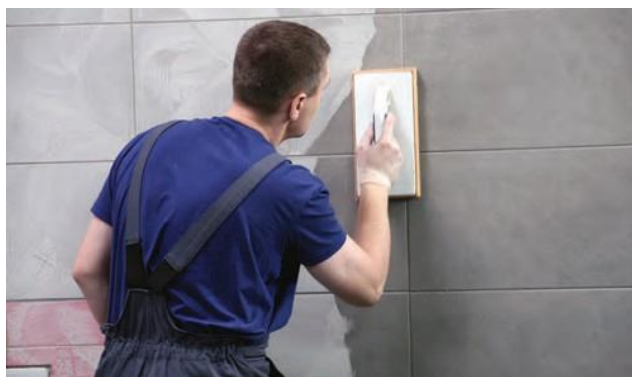
Formavimo trukmė – nuo 5 iki 30 minučių.