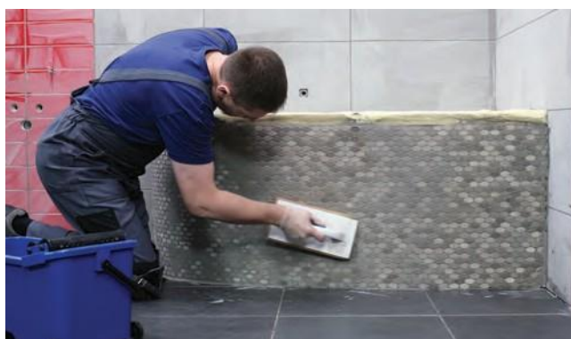
Palaukite. Glaisto formavimą atlikite apvaliais judesiais.