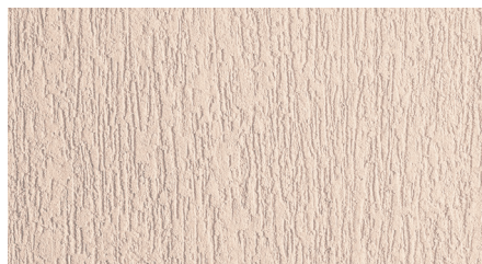
Минеральная штукатурка Ceresit СТ 35, зерно 2,5 мм, инструмент нанесения: стальная терка, инструмент фактурирования: пластмассовая терка.