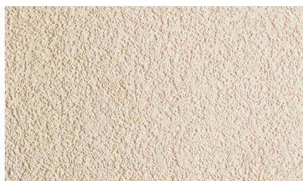
Минеральная штукатурка Ceresit СТ 137, зерно 2,5 мм, инструмент нанесения: стальная терка, инструмент фактурирования: пластмассовая терка.