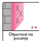
Otpornost na pucanje