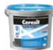
Ceresit CE 40 Ceresit CE 79 Ceresit CE 89