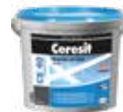
Ceresit CE 40 Ceresit CE 79 Ceresit CE 89