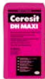
Ceresit DH MAXI Ceresit DA Ceresit CN 76