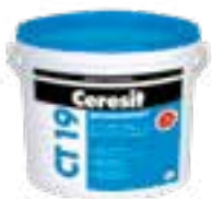
Ceresit CT 19 Ceresit CN 94