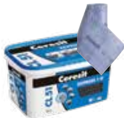
Ceresit CL 51 Express Ceresit CR 100 Ceresit CR 166