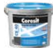
Ceresit CE 40 Ceresit CE 79 Ceresit CE 89