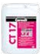
Ceresit CT 17 Ceresit CN 766 Ceresit CN 777