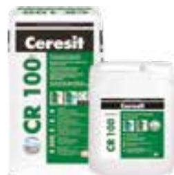
Ceresit CR 100 Ceresit CR 166 Ceresit CL 69