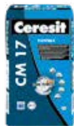
Ceresit CM 17 Ceresit CM 25 Ceresit CM 29 Ceresit CM 49