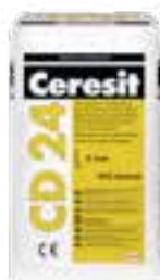
Ceresit CD 24 Ceresit CD 25 Ceresit RS 88 Ceresit CX 5