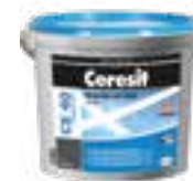
Ceresit CE 40 Ceresit CE 79 Ceresit CE 89