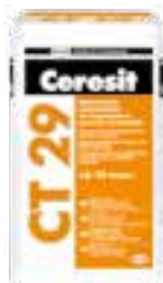
Ceresit CT 29 Ceresit CT 85