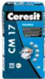
Ceresit CM 17 Ceresit CM 22 Ceresit CM 49 Ceresit CM 77