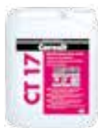
Ceresit CT 17 Ceresit CT 19 Ceresit R777 Ceresit R766