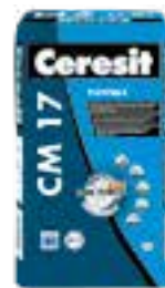
Ceresit CM 17 Ceresit CM 25 Ceresit CM 49