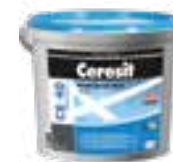
Ceresit CE 40 Ceresit CE 79 Ceresit CE 89