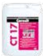
Ceresit CT 17, Ceresit CT 19