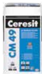
Ceresit CM 49