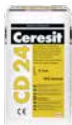
Ceresit CD 24 Ceresit CD 25 Ceresit RS 88 Ceresit CX 5