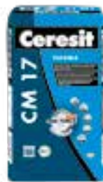
Ceresit CM 17 Ceresit CM 25 Ceresit CM 49