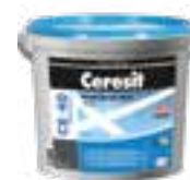
Ceresit CE 40 Ceresit CE 79 Ceresit CE 89