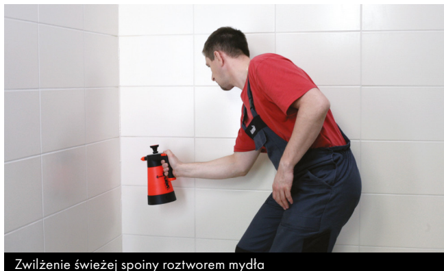
Zwilżenie świeżej spoiny roztworem mydła

W ciągu 5 minut powierzchnię wypełnienia należy spryskać wodnym roztworem mydła i wygładzić podobnie zwilżanym narzędziem, usuwając jednocześnie nadmiar materiału.