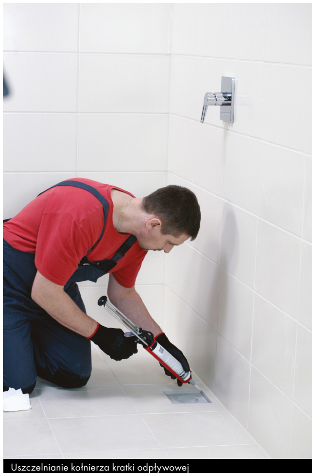
Uszczelnianie kołnierza kratki odpływowej

Zerwać taśmy samoprzylepne, jeśli były stosowane. Świeże zabrudzenia silikonem należy zmyć roztworem wody z mydłem lub benzyną lakową, stwardniałe można usunąć tylko mechanicznie.