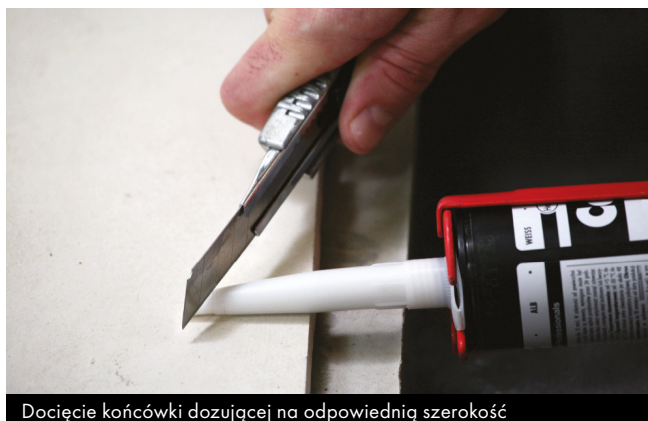
Docięcie końcówki dozującej na odpowiednią szerokość

Odciąć końcówkę kartusza tuż nad gwintem. Nakręcić końcówkę dozującą i dociąć ją odpowiednio do szerokości wypełnianej szczeliny.