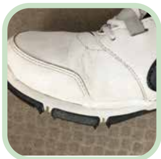
ゴルフシューズのはがれに