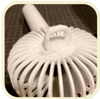
ハンディ扇風機+フック