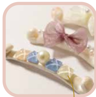
マスククリップ パーツが簡単に付けられるから アクセサリ製作に！