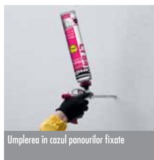
Umplerea în cazul panourilor fixate