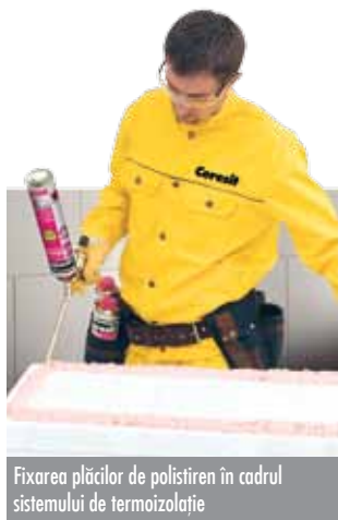
Fixarea plăcilor de polistiren în cadrul sistemului de termoizolație