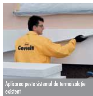
Aplicarea peste sistemul de termoizolație existent