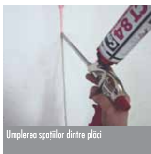
Umplerea spațiilor dintre plăci