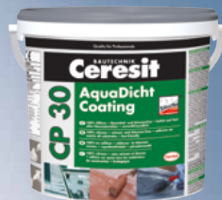
1 kg и 5 kg