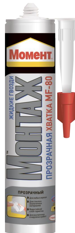
Упаковка: Картридж 300г

** Использовать зеркала соответствующие DIN 1238,5.1 и DIN EN 1036, в случае работы с крупногабаритными объектами обращаться за технической помощью к специалистам.