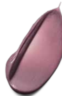
8-19 FROSTED LAVENDER