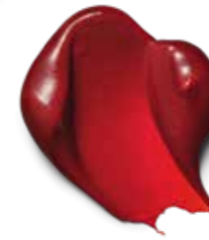
6-88 RUBY RED