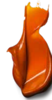
7-77 BRIGHT COPPER