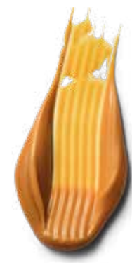
9.5-4 BEIGE SAND