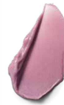
9.5-19 DUSTY PINK