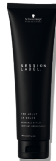
THE JELLY (v)