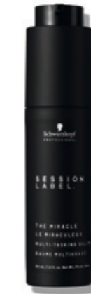
THE MIRACLE (v)