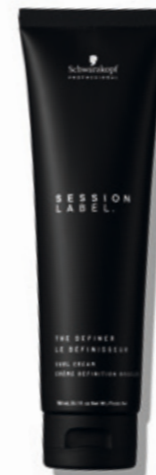
THE DEFINER (v)