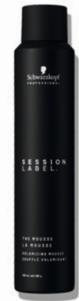
THE MOUSSE (v)