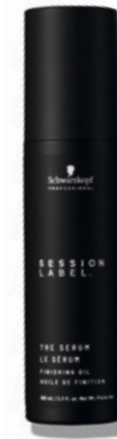
THE SERUM (v)