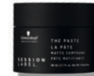
THE PASTE (v)