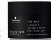
THE MUD (v)

(v) = vegan formule (vrij van dierlijke ingrediënten)