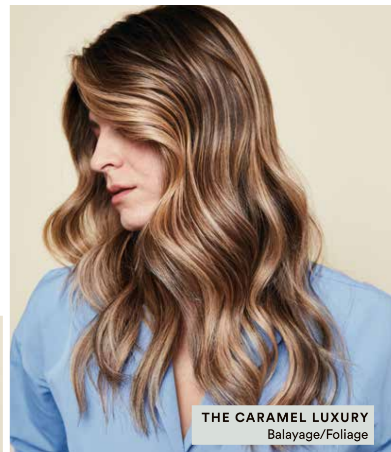
THE CARAMEL LUXURY Balayage/Foliage

Breng het perfecte blond van de salon in balans met deskundig onderhoud thuis met onze BLONDE EXPERT Care.