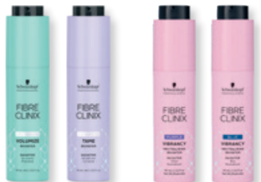
FIJN HAAR STUG HAAR KOEL BLOND OF WITTE HAREN