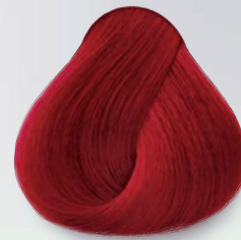
8.66 Rubio Claro Rojo Intenso Light Bright Red Blonde