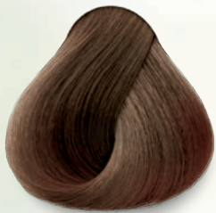
7.3 Rubio Dorado Golden Blonde