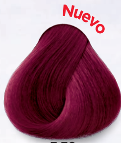
7.76 Rubio Violeta Rojizo Violet Red Blonde