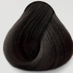
2 Castaño Extra Oscuro Extra Dark Brown