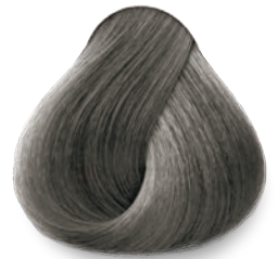
9.9 Rubio Platino Platinum Blonde