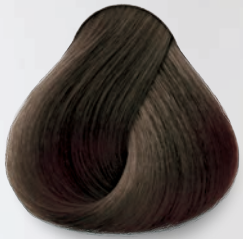
6.12 Rubio Oscuro Cenizo Nacarado Dark Ash Nacre Blonde