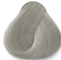
10.11 Rubio Extra Claro Cenizo Intenso Extra Light Deep Ash Blonde