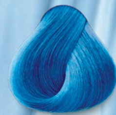
Azul Neón Neon Blue