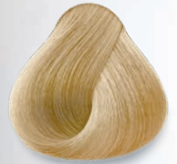
10 Rubio Extra Claro Extra Light Blonde