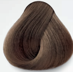
7.35 Capuchino Capuccino