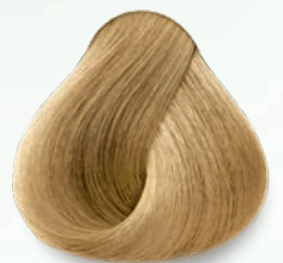
10.22 Rubio Extra Claro Nacarado Intenso Extra Light Deep Nacre Blonde