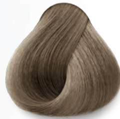
9.11 Rubio Clarísimo Cenizo Intenso Very Light Deep Ash Blonde