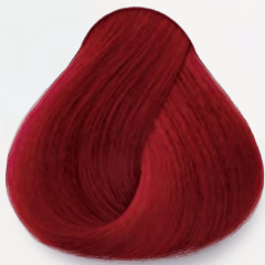
7.66 Rubio Rojo Intenso Bright Red Blonde