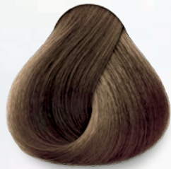
8.11 Rubio Claro Cenizo Intenso Light Deep Ash Blonde