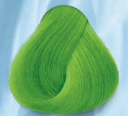
Verde Neón Neon Green

* Úsalo como diluyente para crear colores personalizados * Use it as a dilutive to create custom shades