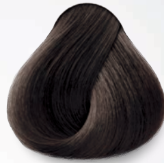
5.1 Castaño Claro Cenizo Light Ash Brown