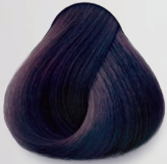
1V Negro Violeta Violet Black