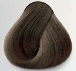
7.1 Rubio Cenizo Ash Blonde