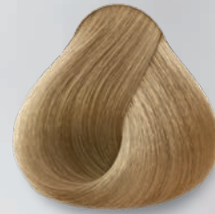
9 Rubio Clarísimo Very Light Blonde