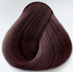
4.65 Borgoña Burgundy