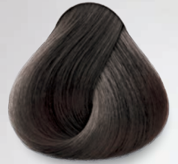
4 Castaño Brown