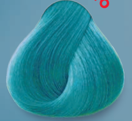
Azul Celeste Sky Blue