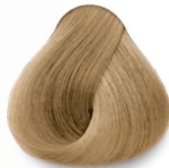
10.31 Rubio Extra Claro Dorado Cenizo Extra Light Golden Ash Blonde