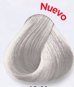
10.21 Rubio Extra Claro Nacarado Cenizo Very Light Ash Nacre Blonde