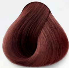
7.5 Rubio Caoba Mahogany Blonde