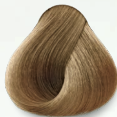
8.22 Rubio Claro Nacarado Intenso Light Deep Nacre Blonde