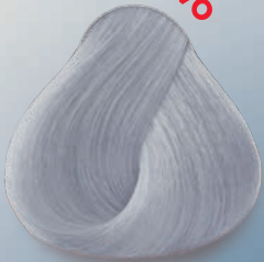
Blanco Titanio White Titanium