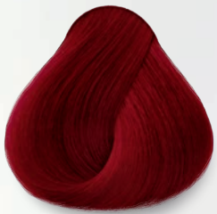
6.66 Rubio Oscuro Rojo Intenso Dark Bright Red Blonde