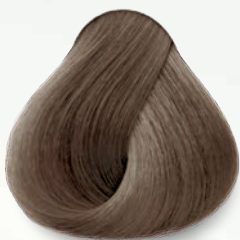
7.22 Rubio Nacarado Intenso Deep Nacre Blonde