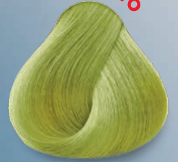
Verde Pera Green Pear