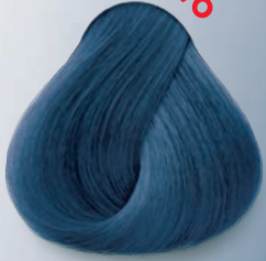
Azul Jeans Blue Jeans