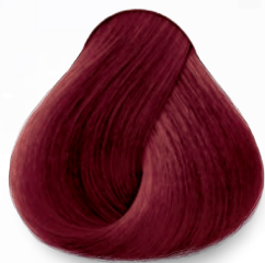
ROJO VIOLETA VIOLET RED