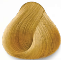
9.33 Rubio Clarísimo Dorado Intenso Very Light Deep Golden Blonde