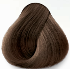
6.23 Rubio Oscuro Nacarado Dorado Dark Nacre Golden Blonde