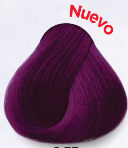
6.77 Rubio Oscuro Violeta Intenso Deep Dark Violet Blonde