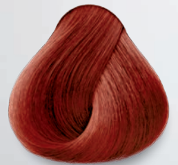
7.64 Rubio Rojo Cobrizo Red Copper Blonde