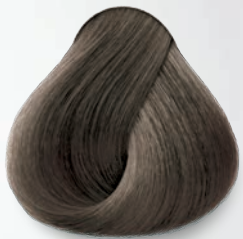
8.1 Rubio Claro Cenizo Light Ash Blonde