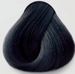
1 Negro Black