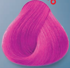
Rosa Neón Neon Pink