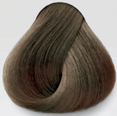
7 Rubio Blonde