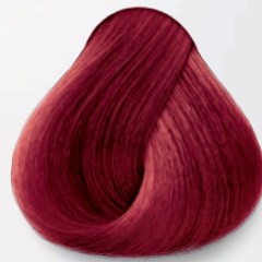
8.62 Rubio Claro Rojo Nacarado Light Red Nacre Blonde