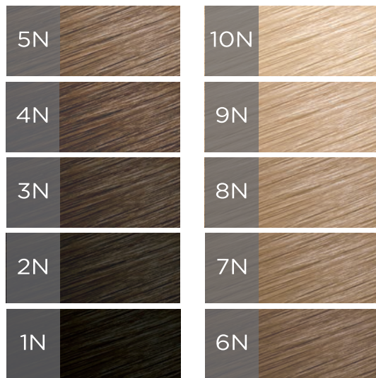
Tabla de Tonos Naturales

La tabla muestra la apariencia de los tonos aplicados sobre la altura de tono correspondientes, los tonos naturales de KÜÜL tienen base azul para evitar tonalidades naranjas.