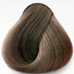
6.22 Rubio Oscuro Nacarado Intenso Dark Deep Nacre Blonde