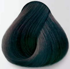
1A Negro Azulado Blue Black