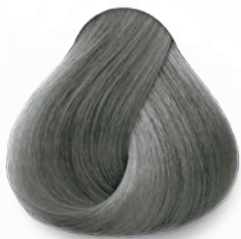
CROMO GRAFITO GRAPHITE CHROME