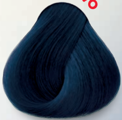
Azul Océano Blue Ocean