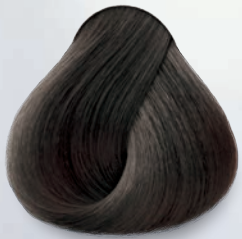
6.11 Rubio Oscuro Cenizo Intenso Dark Deep Ash Blonde