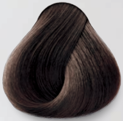
5 Castaño Claro Light Brown