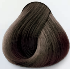
7.11 Rubio Cenizo Intenso Deep Ash Blonde