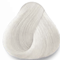
000 Reforzador de la Aclaración Lightening Booster