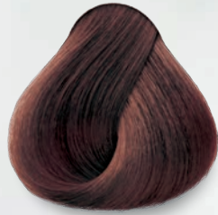
5.45 Moka Mocha