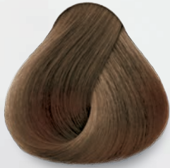
7.31 Latte Machiatto Latte Machiatto