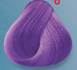
Violeta Neón Neon Violet