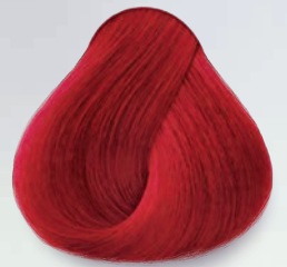
9.66 Rubio Clarísimo Rojo Intenso Very Light Bright Red Blonde