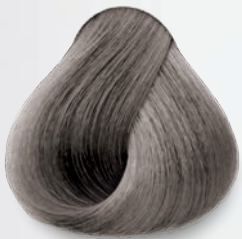
9.1 Rubio Clarísimo Cenizo Very Light Ash Blonde