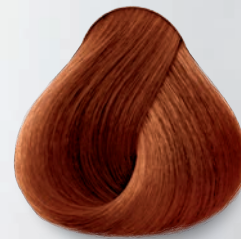
7.44 Rubio Cobrizo Intenso Deep Copper Blonde