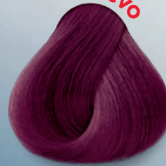
Rojo Violeta Red Violet