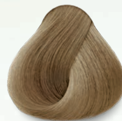
9.22 Rubio Clarísimo Nacarado Intenso Lightening Deep Nacre Blonde