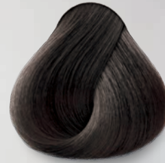
3 Castaño Oscuro Dark Brown