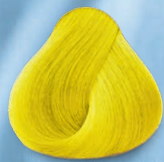
Amarillo Neón Neon Yellow