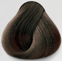
6 Rubio Oscuro Dark Blonde