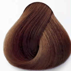
6.34 Rubio Oscuro Dorado Cobrizo Dark Golden Copper Blonde