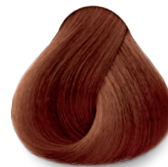
DORADO COBRIZO GOLDEN COPPER