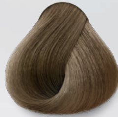
8 Rubio Claro Light Blonde