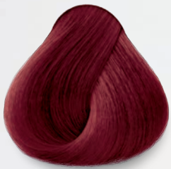
7.62 Rubio Rojo Nacarado Red Nacre Blonde