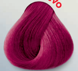
Rojo Rosado Red Pink