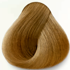
8.3 Rubio Claro Dorado Light Golden Blonde