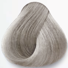
10.1 Rubio Extra Claro Cenizo Extra Light Ash Blonde