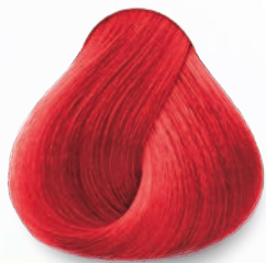
CROMO CORRECTOR CROMO CORRECTOR