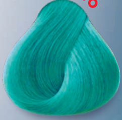
Verde Esmeralda Emerald Green