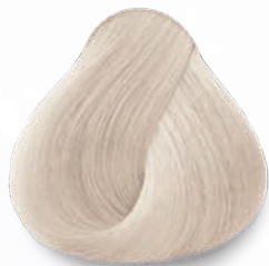
902 Rubio Ultra Claro Nacarado Ultra Light Nacre Blonde