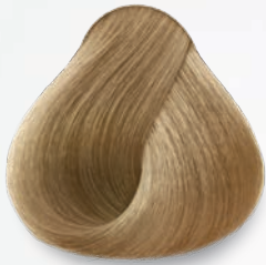
9.12 Rubio Clarísimo Cenizo Nacarado Very Light Ash Nacre Blonde