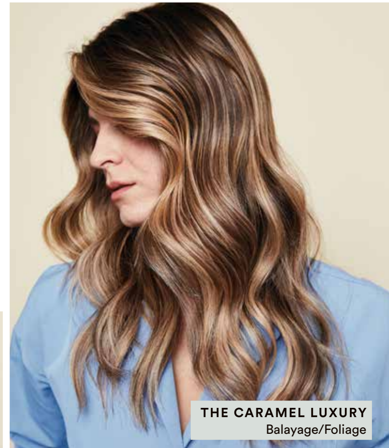
THE CARAMEL LUXURY Balayage/Foliage

Per un biondo sempre perfetto consiglia BLONDE EXPERT Care per il mantenimento a casa.