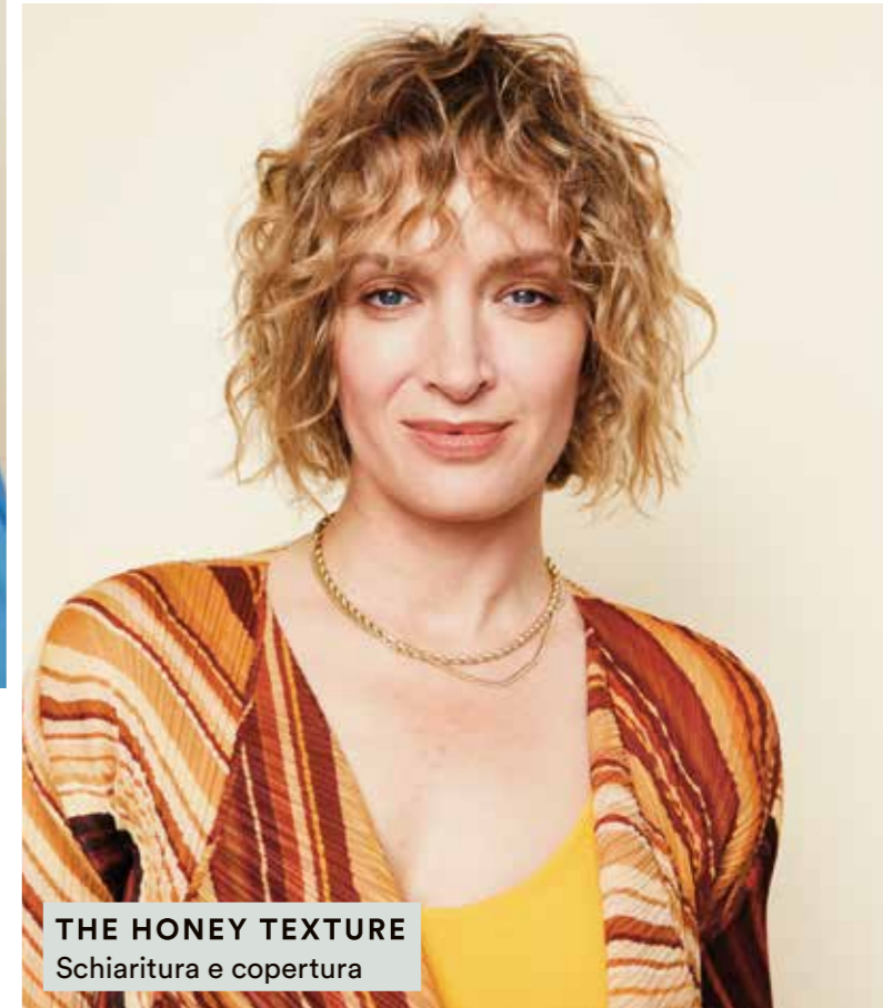
THE HONEY TEXTURE Schiaritura e copertura