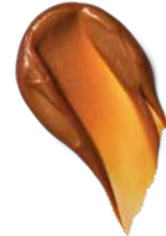
8-46 GLAZED CARAMEL BIONDO CHIARO BEIGE CIOCCOLATO