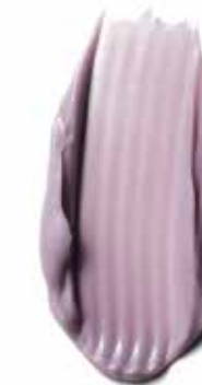
9.5-1 PEARL SILVER PASTEL CENDRÉ