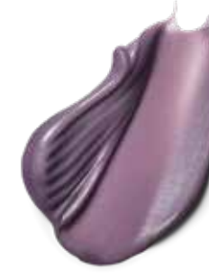
9-12 PLATINUM GREY BIONDO CHIARISSIMO CENDRÉ CENERE