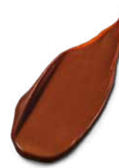
6-46 RAW CACAO BIONDO SCURO BEIGE CIOCCOLATO