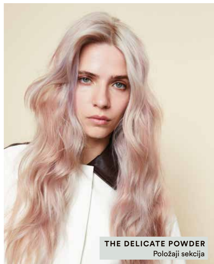
THE DELICATE POWDER Položaji sekcija