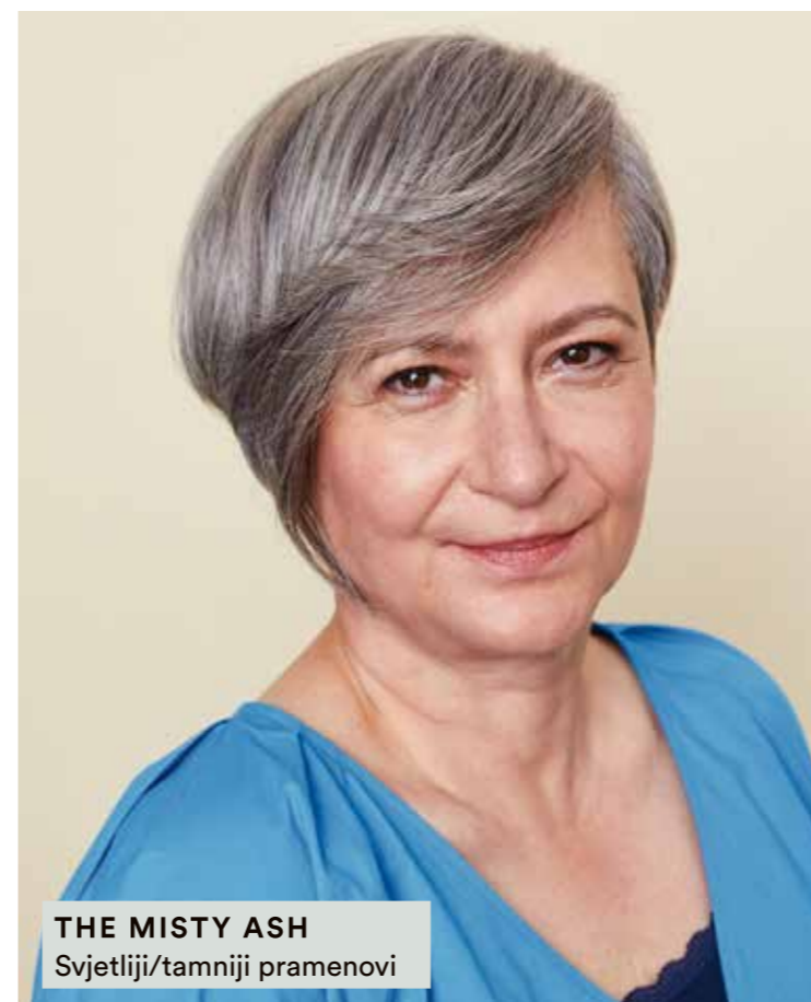
THE MISTY ASH Svjetliji/tamniji pramenovi

Asortiman Highlifts i Pastels za trendi look i proširenu mogućnost usluge za sve baze.