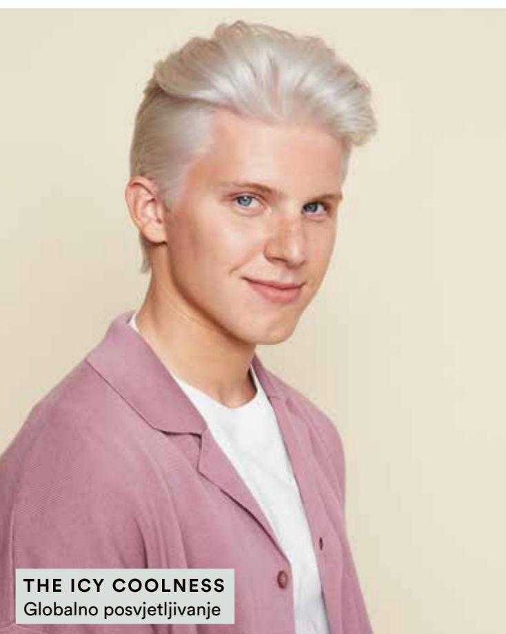
THE ICY COOLNESS Globalno posvjetljivanje

Naša revolucionarna Hair-Bond tehnologija daje vam moć da usavršite svaku blond tehniku tako da možete zadovoljiti jedinstvene želje svojih klijenata i individualne potrebe kose.