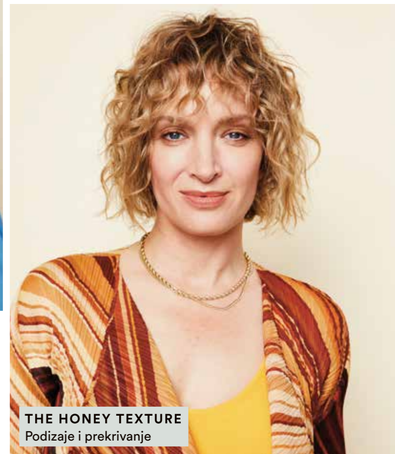
THE HONEY TEXTURE Podizaje i prekrivanje