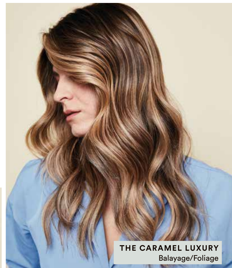
THE CARAMEL LUXURY Balayage/Foliage

Uravnotežite savršenu blond nijansu kao iz salona s kućnim održavanjem koristeći naš BLONDE EXPERT asortiman koloracije.