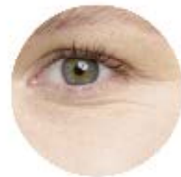
Fond de teint