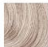
10-19C Blond Ultra Cendré Violet