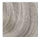
10-12C Blond Ultra Cendré Fumé

Jusqu'à 50% de cheveux blancs : utiliser la nuance souhaitée. Plus de 50% de cheveux blancs : Mélanger en 2:1 avec une nuance naturelle.