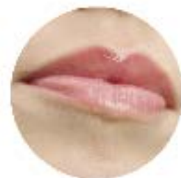
Baume à lèvres teinté