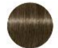
70% de cheveux blancs