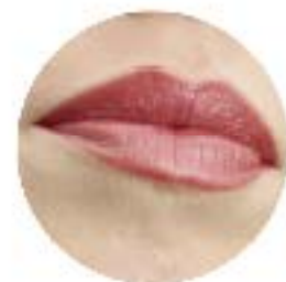
Rouge à lèvres