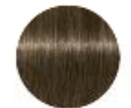
50% de cheveux blancs