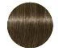
30% de cheveux blancs