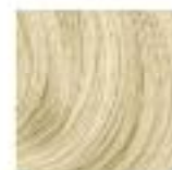
10-56W Blond Ultra Doré Marron