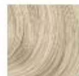
10-51C Blond Ultra Doré Cendré