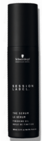
THE SERUM (v)