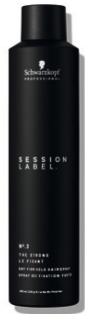
THE STRONG (v)