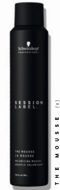
THE MOUSSE (v)