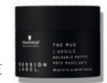
THE MUD (v)

(v) = Vegaaninen koostumus (free from animal-derived ingredients)