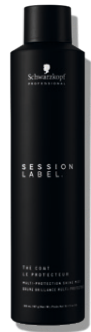
THE COAT (v)