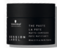
THE PASTE (v)