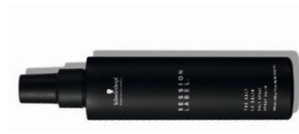
THE SALT (v)