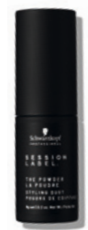
THE POWDER (v)