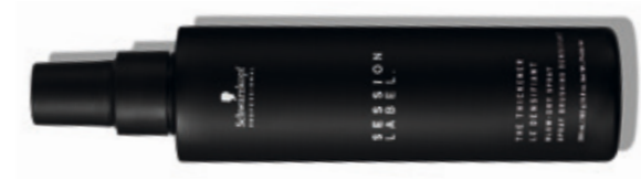
THE THICKENER (v)