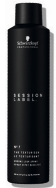
THE TEXTURIZER (v)