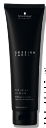
THE JELLY (v)