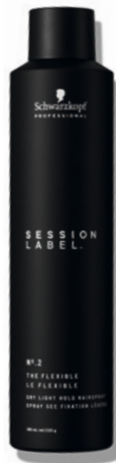
THE FLEXIBLE (v)