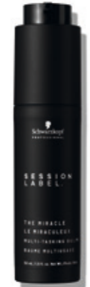
THE MIRACLE (v)