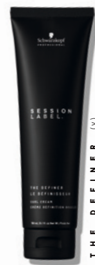
THE DEFINER (v)