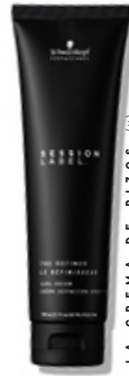
LA CREMA DE RIZOS (v)