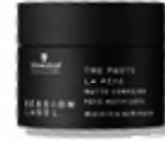
LA PASTA MATE (v)