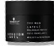
LA ARCILLA MOLDEABLE (v)