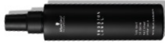
EL SPRAY SALINO (v)