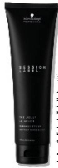
LA GELATINA (v)