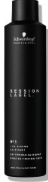
LA LACA DE FIJACIÓN FUERTE (v)