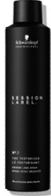
EL SPRAY DE TEXTURA (v)