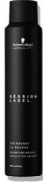
LA ESPUMA EN SPRAY DE VOLUMEN (v)

(v) = fórmula vegana (libre de ingredientes de origen animal)