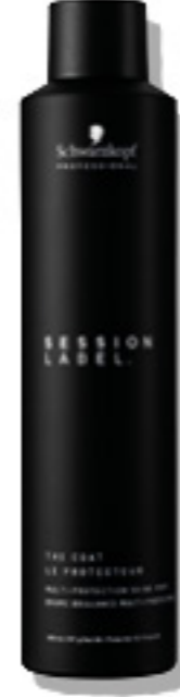
EL PROTECTOR (v)