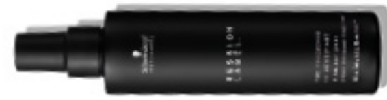
EL SPRAY DE SECADO (v)