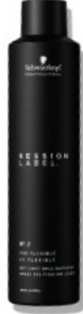
LA LACA DE FIJACIÓN FLEXIBLE (v)