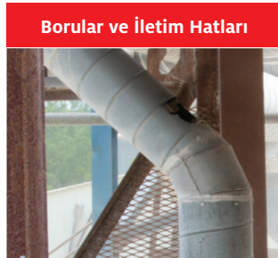
Borular ve İletim Hatları