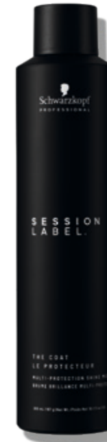
THE COAT (v)