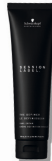
THE DEFINER (v)