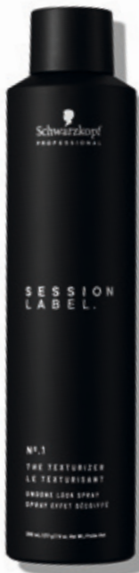
THE TEXTURIZER (v)