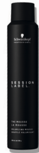
THE MOUSSE (v)