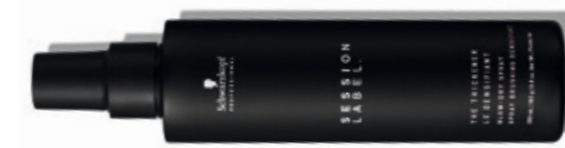
THE THICKENER (v)