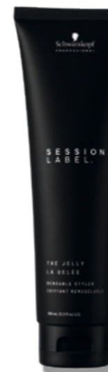
THE JELLY (v)