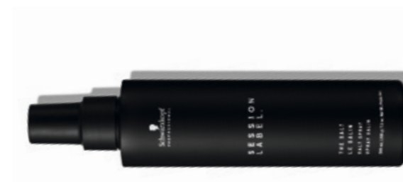
THE SALT (v)