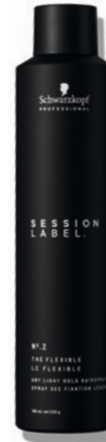
THE FLEXIBLE (v)