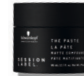
THE PASTE (v)