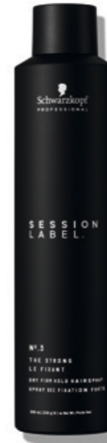
THE STRONG (v)