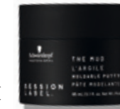
THE MUD (v)

(v) = vegane Formel (frei von Inhaltsstoffen tierischen Ursprungs)