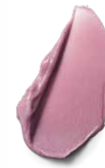
9.5-19 DUSTY PINK