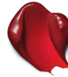
6-88 RUBY RED