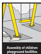
Assembly of children playground facilities