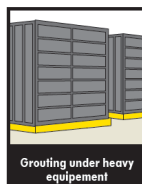
Grouting under heavy equipment