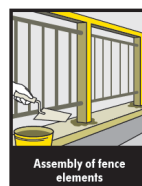
Assembly of fence elements