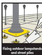
Fixing outdoor lampstands and street piles