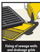
Fixing of sewage wells and drainage grids