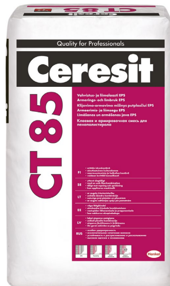
CERESIT CT 85 TDS 11.23

Eelnevalt tuleb kontrollida segu nakkuvust olemasolevate krohvi- või värvikihtidega. Pudenev krohv tuleb aluspinnalt eemaldada. Rohkem kui 20 mm sügavused kriimustused ja defektid tuleb täita pahtliga CT 29 või tsementkrohviga. Määrduvad kohad, materjali imendumist takistavate ainete jäägid, mittehingavad värvikihid ning muud nõrgalt aluspinnaga nakkunud kihid tuleb täielikult eemaldada, kasutades selleks näiteks survepesuseadmeid. Kohad, kus kasvavad sammal või vetikad, tuleb alguses puhastada terasharjaga ning seejärel immutada Ceresit CT 99 vesilahusega. Vanad krohvimata müürid ning tugevad krohvi- ja värvikihid tuleb hoolikalt tolmust puhastada, pesta tugeva surve all veega üle ning oodata, kuni need on täielikult kuivanud. Suurema niiskusesisaldusega, näiteks gaasbetoon- või silikaatplokkidest aluspinnad tuleb üle