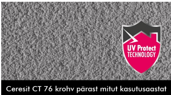
Ceresit CT 76 krohv pärast mitut kasutusaastat