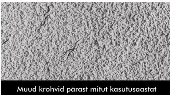
Muud krohvid pärast mitut kasutusaastat