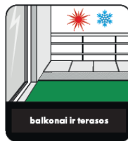
balkonai ir terasos

*30 % mažiau dulkių, palyginti su senos receptūros CR166 be „Fibre Force“ technologijos