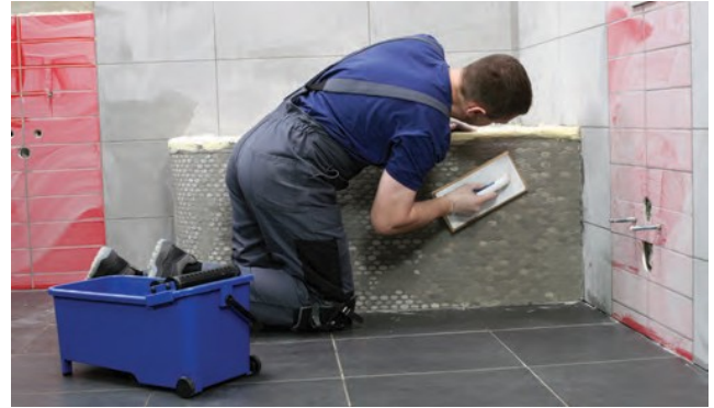
CE 40 java ir piemērota arī mozaikas izšuvošanai.

audumu, jo, ieberzējot izžuvušo šuvju javu mitrā javā, pastāv risks, ka var mainīties krāsa. Pa flīzēm var staigāt jau 6 stundas pēc izšuvošanas. Tad ir atļauta arī sausā tīrīšana (iepriekš pārliecināties, ka šuvju pildījuma virsma ir pilnībā sausa) un, ja nepieciešams, flīžu tīrīšana ar mitru, asu sūkli. Pirmoreiz ūdens iedarbībai javu var pakļaut pēc 24 stundām. Pirmās 5 dienas pēc uzklāšanas tīrīšanai izmantot tikai tīru ūdeni bez jebkādu tīrīšanas līdzekļu pievienošanas. Pilnībā hidrofobas īpašības (izturība pret ūdens uzsūkšanos) javas sasniedz 5 dienas pēc tās uzklāšanas.