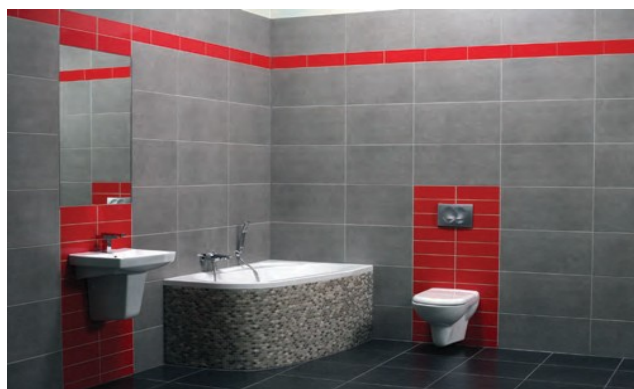
Īpašā SilicaActive sastāva dēļ CE 40 šuvei ir izturīga un intensīva krāsa.