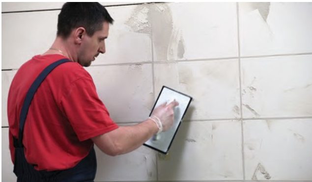
Šuves starp flīzēm ar CE 40 javu jāaizpilda precīzi.

CE 40 ir jāieber iepriekš nomērītā tīra ūdens daudzumā un jāsamaisa, līdz tiek iegūta viendabīga masa bez kunkuljiem. Neizmantojot sarūsējušus vai netīrus traukus un darbarīkus. Pagaidīt 3 minūtes un samaisīt vēlreiz. Izklieš javu pa flīžu virsmu ar gumijas rīvdēli vai skrāpi. Jāpievērš uzmanība, lai piebļīvējot šuves, starp flīzēm nepaliktu atstarpes.