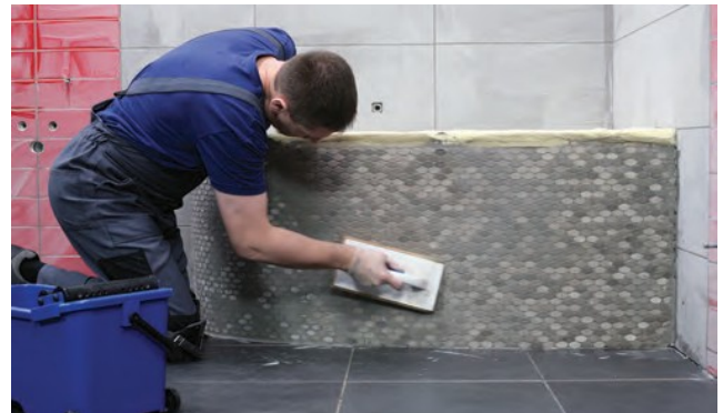
Profilējot jāizdara aplveida kustības.