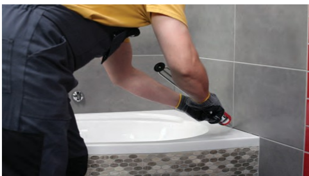
Šuves ap sanitārtehnikām ir jāaizpilda ar sanitāro silikonu.