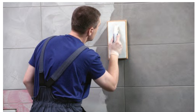
Profilēšanas laiks ir no 5 līdz 30 minūtēm.