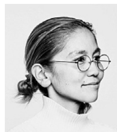
イセキリエ THE REMMY