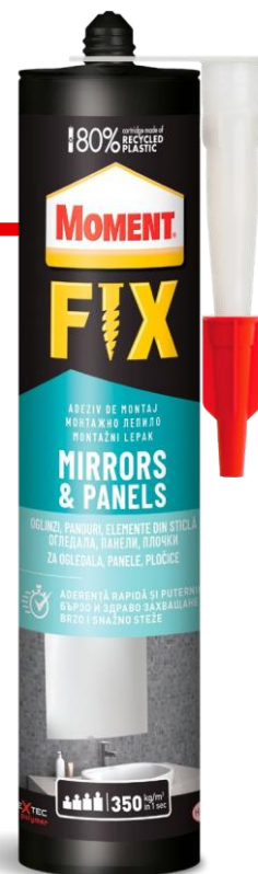
MOMENT_FIX Mirrors & Panels_TDS_05_2022